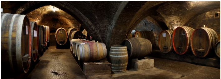
Unser Holzfass Keller