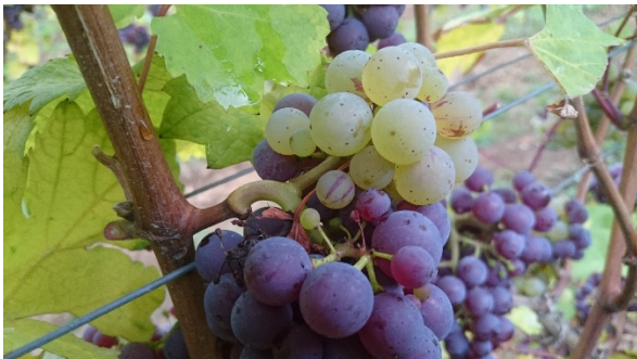
Roter Riesling mit weißem Riesling Mutation