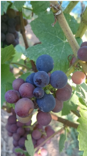
Grauburgundemutationr mit einzelnen Spätburgunderbeeren

Mit dieser Preisliste verlieren alle früheren Listen ihre Gültigkeit